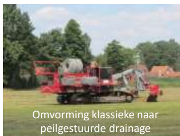
Omvorming klassieke naar peilgestuurde drainage