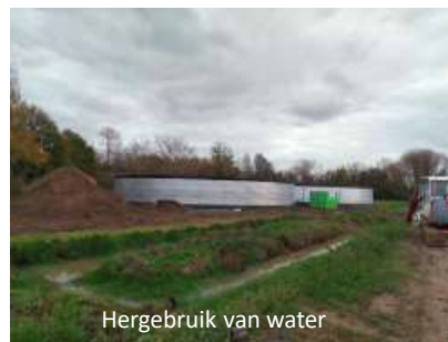
Hergebruik van water