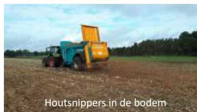
Houtsnippers in de bodem